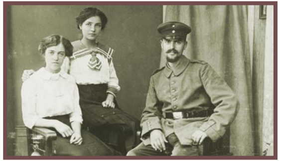
第一次世界大戰：我的父親和他的姊妹們

爸爸好高興啊！我們興高采烈地重享天倫之樂！媽媽告訴我，多年來爸爸從沒有停止為我迫切而堅定的禱告：「上主，不管代價如何，請幫助她找到您！」爸爸，謝謝你沒有放棄我，和幫助我找到真正的快樂！