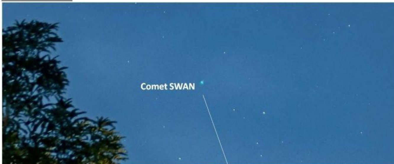
Dr Ski in Valencia, Philippines (latitude 9 degrees north), caught this image of the comet on May 2, 2020

¡DE MANERA QUE YO CREO QUE EL COMETA HALLEY (¿EL CISNE EN EL 2020?) VA A ANUNCIAR LA VENIDA DEL FALSO MESÍAS, DEL ANTICRISTO!