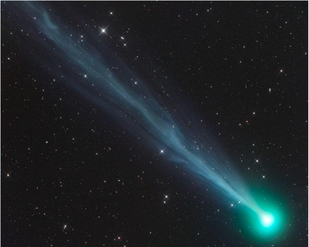
Comet C/2020 F8 SWAN 01 05 2020 - Farm Tivoli, Namibia/SW-Africa