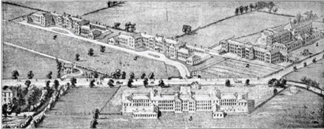
Las cinco Casas de Huérfanos, Ashley Down en Bristol.

30 de Septiembre de 1868 – Recibí de Yorkshire $250 dólares. También hoy hemos recibido $5 000 dólares para la obra del Señor en China. Acerca de estos donativos es preciso señalar, que durante meses he tenido el ardiente deseo de empeñarme más que nunca en la obra misionera en China, y he dado los pasos necesarios para llevar a cabo mi deseo, entonces me han llegado a la mano estos donativos. Esta preciosa respuesta a la oración por recursos, debería ser una motivación especial para todos aquellos que están comprometidos en la obra del Señor, y que necesitan Sus recursos para llevarla a cabo. Esto nos prueba de nuevo que, si nuestra obra es Su obra, y le honramos mirándolo sólo a Él y esperando de Él, los recursos para llevarla a cabo, Él ciertamente a Su tiempo y a Su manera, los suplirá.