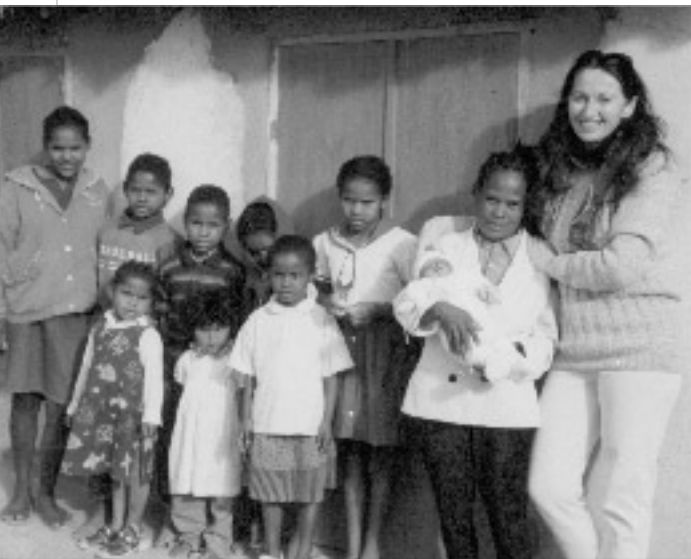
Uma mulher pequena com uma fé gigante!