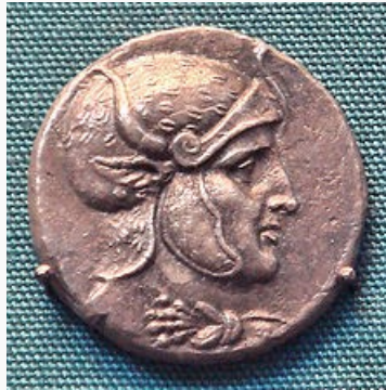
Moneda de Seleuco I Nicátor.

apodado el vencedor. Seleuco I reinó sobre un vasto territorio desde Siria hasta la India . La profecía lo llama el rey del norte .