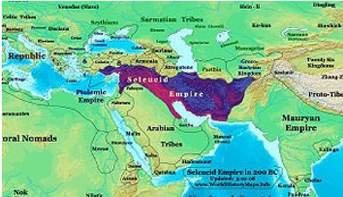
Imperios Seléucida (Rey del Norte) y Ptolémico (Rey del Sur)